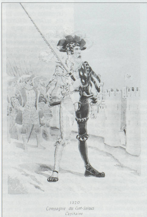
Capitaine des Cent-Suisses de la Garde du Roy en 1520