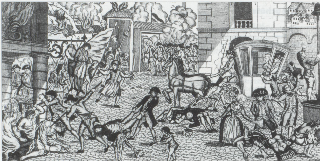
« Horribles attentats des François comis à Paris le 10 d'août 1792 » Iconothèque du Musée des Suisses de l'Étranger, Château de Penthes.

A la mémoire de Romain de Diesbach-Steinbrugg mort le 2 septembre 1792 et à tous les Suisses morts pour la France.