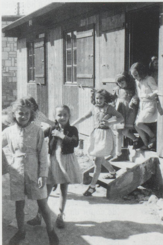
Check-up passé, sortie de la baraque