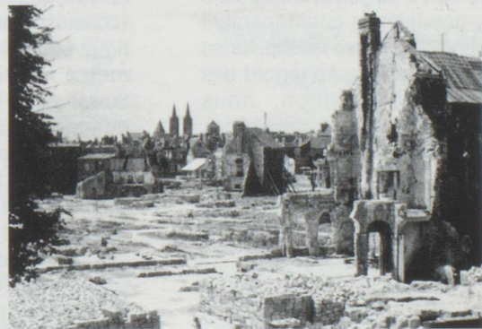
Le lieu d'implantation