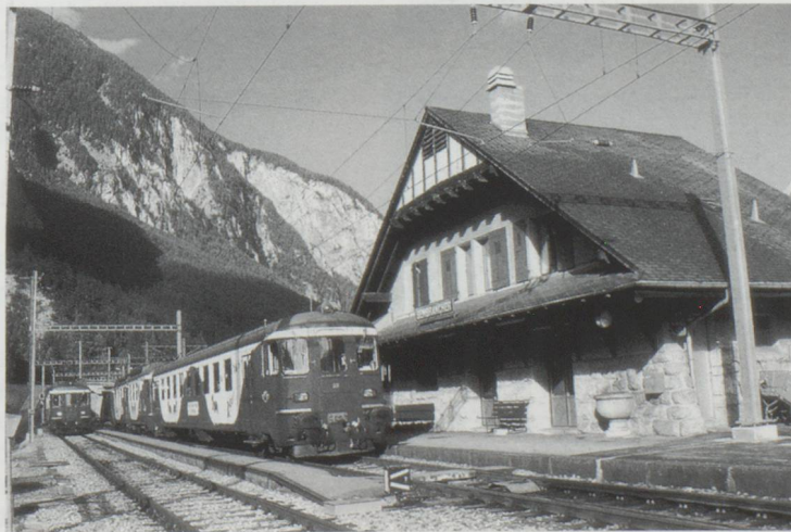
Le Saint-Bernard Express, initialement conçu pour rejoindre l'Italie, part de Martigny et s'arrête à Orsières. Là, les services routiers prennent le relais pour le passage du Col du Grand St Bernard.

A noter, pour les personnes alléchées par ce commerce de plus en plus accessible techniquement, que ce délit, en Suisse, est passible de 20 ans de réclusion.