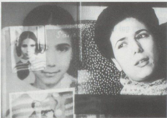
Babylon 2 de Samir Schweiz (1993)

Le film documentaire, c'est une tradition helvétique. Classique ou expérimental, il occupe une place prépondérante dans la production cinématographique suisse. Nombreux sont les réalisateurs de fictions ayant contribué à la richesse du genre. Cela tient tant à la culture qu'au cadre légal qui a longtemps favorisé cette forme d'expression. En 1963, une loi fédérale prévoyait de soutenir le documentaire (et non la fiction).