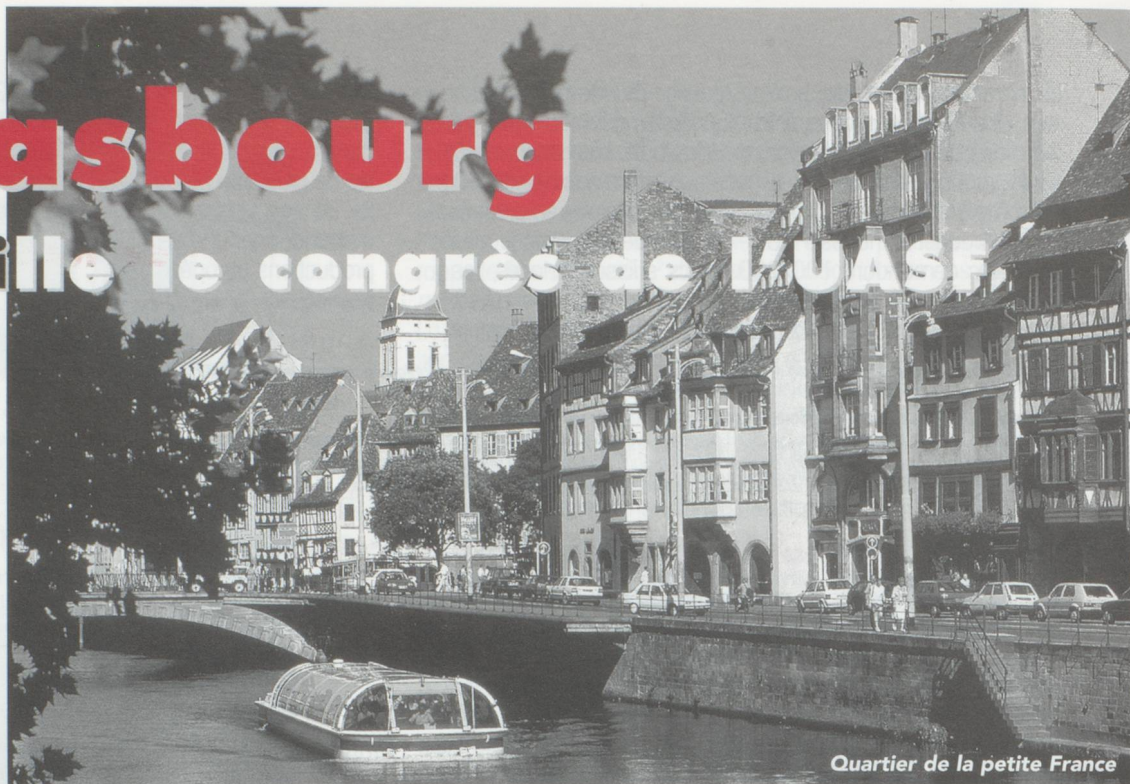
Quartier de la petite France

Vous serez heureux de pouvoir assister les 26 et 27 avril 1997 au congrès de l'UASF qui vous proposera un riche programme. Vous pourrez également profiter de votre passage en Alsace pour visiter une partie de ses 1260 monuments historiques ! vous retrouverez tout le riche passé de la belle ville de Strasbourg qui figure sur la liste du patrimoine mondial.