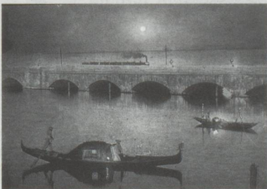
Venise, Pont de la Libertà

Né au Tessin, certainement entre 1822 et 1824, cet amateur d'images après huit ans de vie parisienne, s'installe à Venise comme opticien et photographe. Dès 1854, Carlo Ponti photographie la célèbre ville d'eau, Venise. Et, c'est un catalogue de 160 clichés qui sera présenté en 1855 à l'Exposition universelle de Paris. Artiste mais aussi technicien, il met au point en 1860, l'Aletoscopio, visionneuse pour image photographique de grand format. Puis, en 1862 il fabrique le Megalestoscopio, version agrandie du premier appareil, pour lequel il obtient le Grand Prix à l'Exposition internationale de Londres. En 1866, Carlo Ponti devient le photographe officiel de Sa Majesté Victor Emmanuel II alors à la tête du royaume de Sardaigne et couronné roi d'Italie le 27 avril 1861. Le photographe meurt à Venise le 16 novembre 1869, complètement aveugle, sans jamais avoir renoncé à sa qualité de citoyen suisse.