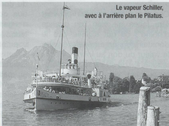
Le vapeur Schiller, avec à l'arrière plan le Pilatus.

La vapeur à roues Schiller va suivre dès cet automne une cure de jouvence. Cette révision générale d'une des plus belles unités du Lac des Quatre-Cantons a été devisée à 5,8 millions de francs suisses. Une grande partie du coût des travaux sera supportée par l'Association régionale des amis de la vapeur. Le Schiller est sorti en 1906 des ateliers Sulzer frères de Winterthur. Ce bateau-salon a la réputation d'être l'un plus beaux vapeurs à aubes des lacs helvétiques.