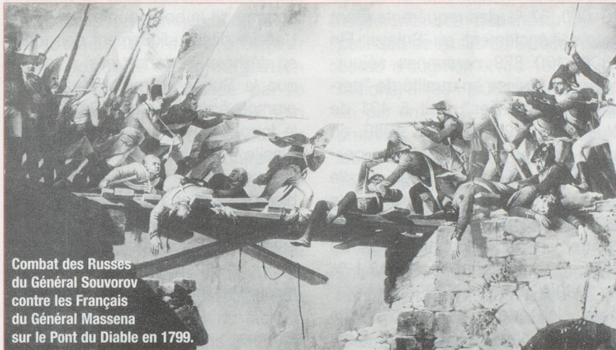
Combat des Russes du Général Souvorov contre les Français du Général Masséna sur le Pont du Diable en 1799.

L'unité de mesure usuelle, le «Saum», équivalait à environ 158 kilogrammes. En général, le transport par le St-Gothard durait «seulement» quatre jours. Le transport de messages joua lui aussi un rôle non négligeable. Qui n'a pas entendu, ou même fredonné, la célèbre chanson : «Je suis du Gothard le dernier postillon» ?