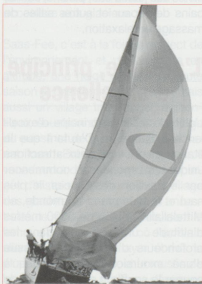
La Suisse présentera deux défis pour la prochaine Coupe de l'America.

L'érosion des effectifs des syndicats se poursuit en Suisse. L'Union syndicale suisse a perdu plus de 30 000 membres en six ans. Pour stopper l'hémorragie, elle réfléchit depuis 1994 à la modernisation de ses structures. Les conclusions de ses réflexions ont été présentées le mois dernier à Berne. L'USS explique la baisse de ses effectifs par la diminution du nombre d'emplois, la plus grande mobilité du marché du travail et le départ de très nombreux étrangers autrefois employés dans la construction. Parmi les cinq scénarios élaborés pour inverser la pente, le groupe de réflexion de l'USS semble privilégier soit une approche confédérale, qui intégrerait verticalement les fédérations selon les différentes branches d'activité soit un type de coopération plus souple, dite à géométrie variable entre les fédérations. Le Congrès de l'USS choisira sa stratégie en 1998.