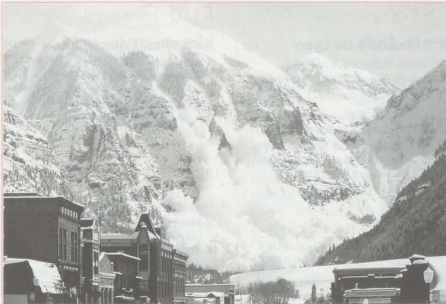
Le Centre alpin universitaire pour les dangers naturels permettra de mieux prévoir les catastrophes.