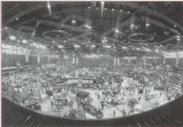
Le dernier Salon de l'auto à Palexpo

NDLR : Au moment où l'avenir de l'AVS facultative des Suisses de l'étranger est débattu, on peut effectivement se poser des questions.