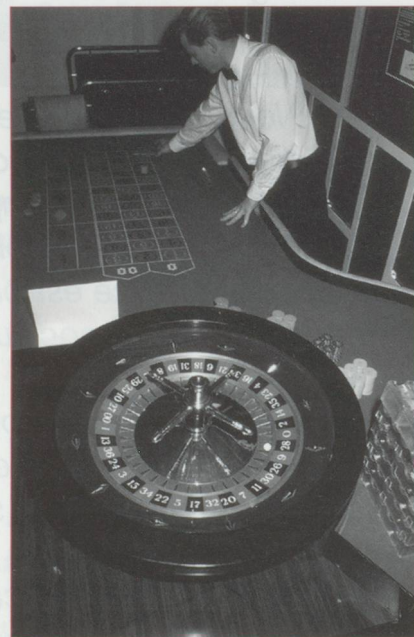
À quand deux catégories de casinos en Suisse? Une réforme en projet prévoit qu'excepté sept maisons de jeux triées sur le volet, les casinos fonctionneront avec des mises limitées.

Près de 730 militaires épauleront la police lors du centenaire du 1 er Congrès sioniste de 1897 qui réunira 1 500 personnes le 31 août prochain à Bâle.