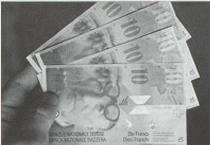
Le nouveau billet de 10 francs est en circulation. Il comporte un portrait de Charles-Edouard Jeanneret dit Le Corbusier.

Record d'affluence en 1996 pour les musées suisses, à commencer par le Musée des transports de Lucerne (473 500 visiteurs), la Fondation Gianadda (368 800 visiteurs), et le Château de Chillon (287 000 visiteurs).