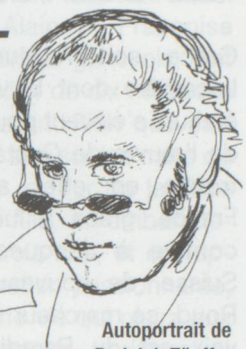
Autoportrait de Rodolph Töpffer