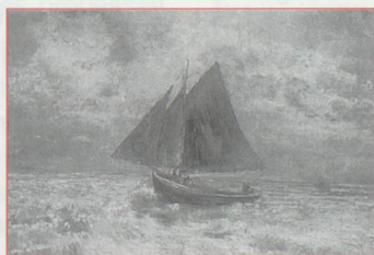
Le Bateau Rouge Odilon Redon, 1906-07.

Villa Flora, Stadthausstrasse 6, CH6400 Winterthur - Tél. : 00 41 52 212 99 66 Heures d'ouverture : du mardi au samedi de 15 h à 17 h, le dimanche de 11h à 15h.