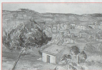
La Plaine Provençale Paul Cézanne, 1886-90.