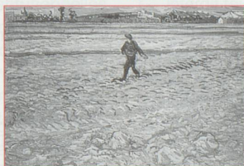
Le Semeur Vincent Van Gogh, 1888.