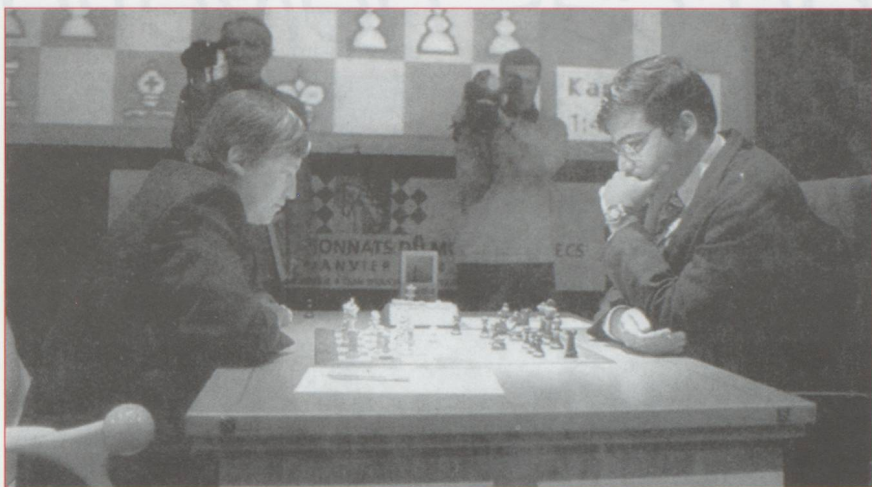
Karpov conserve son titre à Lausanne : pour la première fois dans l'histoire des Championnats du monde d'échecs, le titre s'est joué au termes de parties rapides. Les deux premières auront suffi au russe (à gauche) pour défaire son challenger, l'indien Viswanathan Anand.

de l'emmental va demander l'Appellation d'Origine Contrôlée.