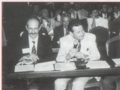
«La Suisse doit être présente et active dans les institutions et les accords internationaux»

Ce fut la tâche de notre diplomatie et de nos délégations commerciales d'obtenir, au prix d'âpres négociations, aussi difficiles avec les Alliés qu'avec les Allemands, que les libertés des relations diplomatiques et commerciales garanties aux neutres fussent respectées. Le III ème Reich était en position de force. D'abord l'Allemagne était traditionnellement et reste, le premier partenaire commercial de la Suisse, lui fournissant plus de 20 % de ses importations et lui achetant 1/3 de ses exportations. Elle détient le charbon et le fer indispensables à