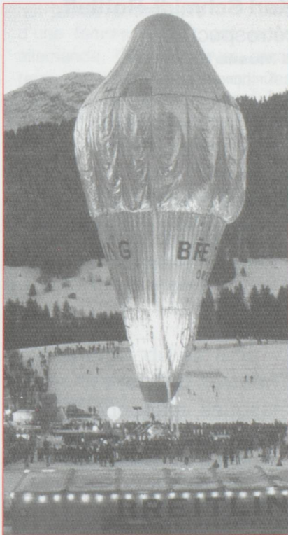
Cette fois ils sont bien partis. L'équipage du Breitling Orbiter 2 emmené par l'aérostier vaudois Bertrand Piccard a décollé du terrain d'envol du Château-d'Oex pour un périple de trois semaines autour du monde.

dans le roc, creusant des puits et des aqueducs, ont mis au point et perfectionné un ingénieux système de roues hydrauliques superposées mues par les eaux d'une chute souterraine. La visite se pratique en descente, en commençant par le quatrième étage du moulin à grain, situé à hauteur de l'entrée naturelle de la grotte. Un toit y double la roche perméable, construit à l'époque pour protéger de la pluie les hommes et la précieuse farine. Des paliers de bois conduisent à l'étage inférieur, à moins que l'on emprunte l'échelle du meunier pour découvrir deux meules à l'équerre, d'une dureté de silice. Au deuxième étage, les entrailles de la machine, où l'engrenage et l'axe de transmission dévoilent leur secrète mécanique. Au fonds du puits, l'eau s'écoule sous la voûte et les marches de pierre, faisant fleurir ici ou là de petites touffes végétales. Dans le plus profond des trois puits, à 32 mètres sous le niveau du sol, se trouvait au siècle dernier la scierie, dont la grande roue, actionnée par un axe de 20 mètres, avait besoin de toute la force de l'eau pour s'ébranler. En sortant de la grotte, une petite visite au musée des Moulins s'impose, pour découvrir les différentes étapes qui, de la récolte au four du boulanger, métamorphosent les céréales en pain. Moulins souterrains du Col-des-Roches, Col 23, 2412 Le Col-des-Roches. Tél. : 00 41 32 931 89 89