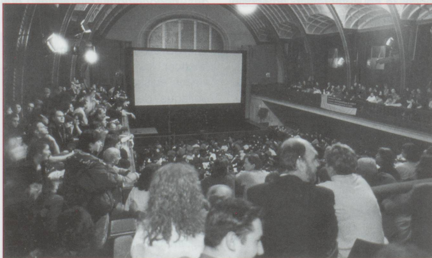
Salle comble aux 33 e Journées cinématographiques de Soleure. Sur les cinq jours de festival, 30 000 spectateurs ont pu voir 200 films, documentaires et courts métrages (70% de la programmation), ainsi qu'une rétrospective Claude Goretta réunissant neuf de ses oeuvres majeures, parmi lesquelles L'Invitation, Vêpres de la Vierge et son grand succès de 1977, La Dentellière.

semble pour le moins étonnant de trouver des traces de ces monstres sur des parois escarpées de Moutier. L'explication est simple : à l'époque, la région était plate et bordait la Mer de Thétys. Les dinosaures marchaient au bord de l'eau sur un sol calcaire et vaseux qui s'est brusquement relevé sous l'effet des plissements sismiques lors de la formation de la chaîne jurassienne. Le calcaire s'est solidifié, les empreintes sont restées. Pour l'instant, seuls les alpinistes confirmés peuvent approcher les traces. Pour les touristes moins agiles à la varappe, un télescope public a été installé en face de la paroi du Raimeux et un vaste projet est à l'étude : il prévoit pour les prochaines années un sentier didactique balisé de panneaux explicatifs qui permettra au