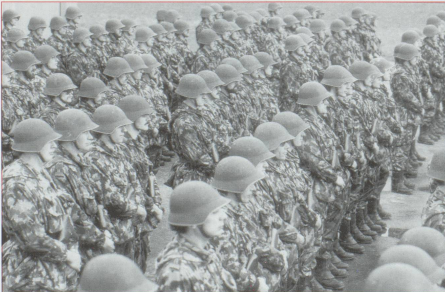
L'armée suisse sera ramenée de 400 000 à 358 000 hommes.

Une étude publiée dernièrement par la Banque Pictet & Cie passe le système fiscal suisse au peigne fin et revient sur quelques idées reçues. La part des différents impôts dans le budget de la Confédération est comparée à celle des grands pays de l'OCDE (les États-Unis, la France, l'Allemagne et le Royaume-Uni). Premier constat : 44,3% des recettes fiscales proviennent en Suisse de l'impôt sur le revenu, sur la fortune et sur les gains en capitaux mobiliers et immobiliers, ce qui