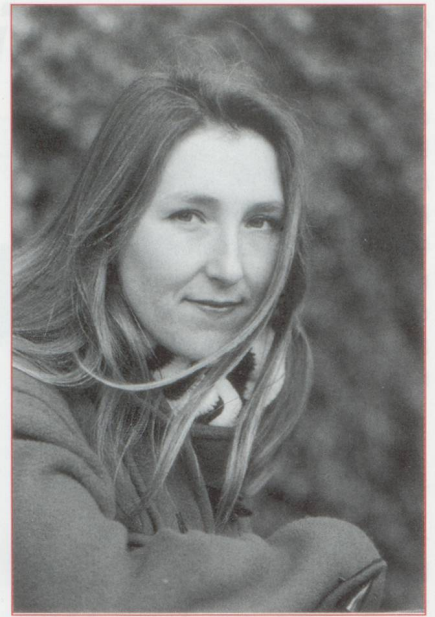
Marie Darrieussecq sur les traces de Lewis Carroll