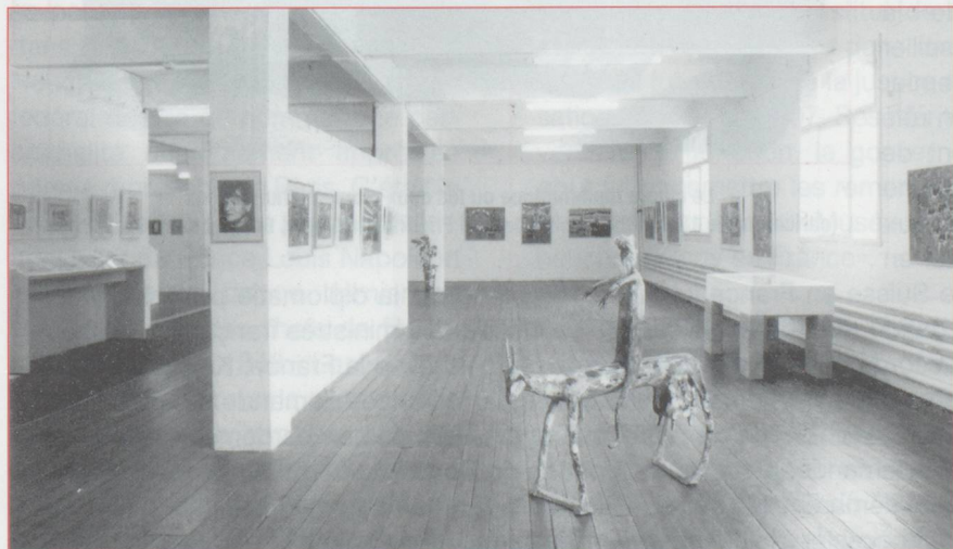
La Fondation pour l'art naïf suisse de St-Gall fête ses dix ans. Dix ans après sa création, sa collection compte 1300 œuvres de 80 artistes et 46 expos à son actif. L'institution, qui dispose depuis 1995 de son propre musée à St-Gall, a édité 17 publications. Renseignements : 00 41 71 223 58 57

Le comédien Jean-Luc Bideau envisage de quitter la Comédie Française. Il estime qu'avec l'actuel administrateur, il n'a pas la possibilité d'avoir des rôles intéressants. En attendant, il se prépare à jouer "Les Huissiers" de Michel Vinaver au Théâtre de la Colline.