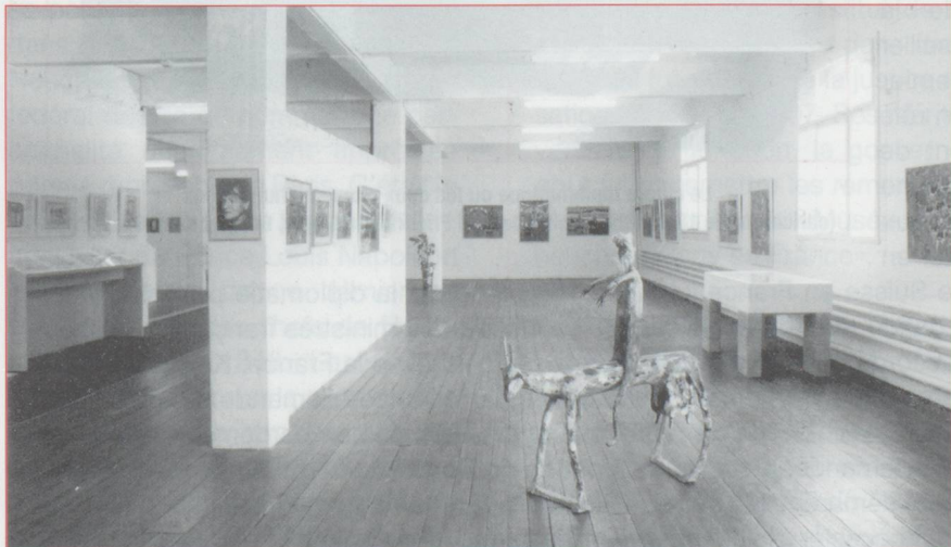
La Fondation pour l'art naïf suisse de St-Gall fête ses dix ans. Dix ans après sa création, sa collection compte 1300 œuvres de 80 artistes et 46 expos à son actif. L'institution, qui dispose depuis 1995 de son propre musée à St-Gall, a édité 17 publications. Renseignements : 00 41 71 223 58 57

Le comédien Jean-Luc Bideau envisage de quitter la Comédie Française. Il estime qu'avec l'actuel administrateur, il n'a pas la possibilité d'avoir des rôles intéressants. En attendant, il se prépare à jouer "Les Huissiers" de Michel Vinaver au Théâtre de la Colline.