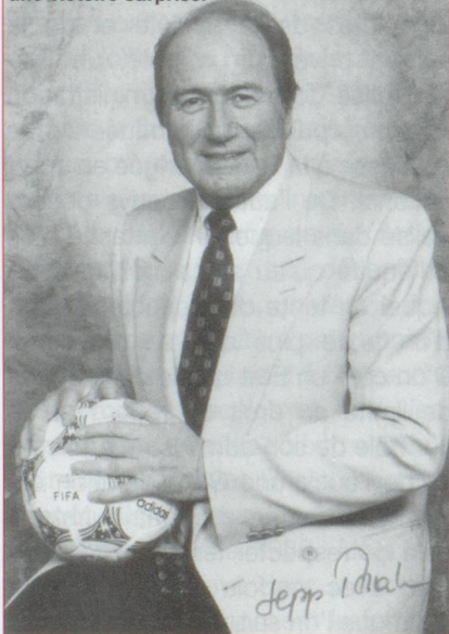
Joseph Blatter à la tête de la FIFA : une victoire surprise.