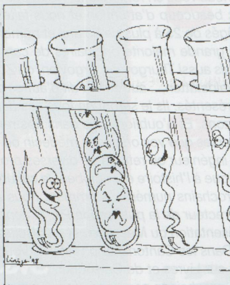
MLF... PAS D'ÉGALITÉ POUR LES OVULES!

La nouvelle Constitution prend forme. Les deux Chambres en ont achevé la première lecture. Il y a eu 105 divergences entre les 2 Chambres. Un comité de médiation a ramené les questions fondamentales d'opposition à une quinzaine de points, qui seront discutés jusqu'en décembre. Une ultime session spéciale se tiendra le cas échéant du 18 au 20 janvier 1999. Le 18 avril 1999, le peuple se prononcera sur la réforme et le 13 juin sur la réforme de la justice. Le volet des droits populaires aura peu de chance d'être soumis au peuple avant les élections de l'automne 1999.