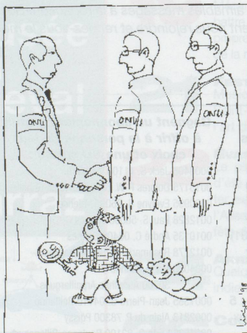
M'SIEUR L'ONU, J'PEUX JOUER AVEC VOUS?