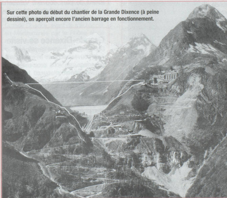
Sur cette photo du début du chantier de la Grande Dixence (à peine dessinée), on aperçoit encore l'ancien barrage en fonctionnement.

Le chantier fut dantesque. Pendant près de dix ans, de 1951 à 1961, avec trois ans d'avance sur le calendrier, 2 000 personnes travaillaient sur le plus grand chantier de construction de l'histoire, destiné à construire ce qui resta très longtemps le plus haut barrage du monde. Imaginez l'installation de voies de communication pour la construction des usines qui prenaient de transformer les miradors en excavés en béton, les téléphériques, les trains de chantier, les forages et les injections dans la montagne, qui deux cent mètres sous le barrage en assurent l'anchorage et l'étanchéité. Le barrage en construction, ce sera 700 m de long et 285 m de haut, ce sera 15 millions de tonnes de roche et de béton retenant 400 millions de m 3 d'eau.