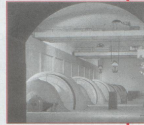
Vue de la centrale souterraine de Fionnay

Mais alors où sont les turbines et les usines ? C'est une question que paraît-il posent souvent les visiteurs du barrage. C'est oublier que ce qui fait la force de l'eau, c'est la hauteur de chute. À l'exception de Fionnay, les usines sont toutes en bas dans la vallée, à proximité du Rhône, là où l'eau aura pris un maximum d'élan.