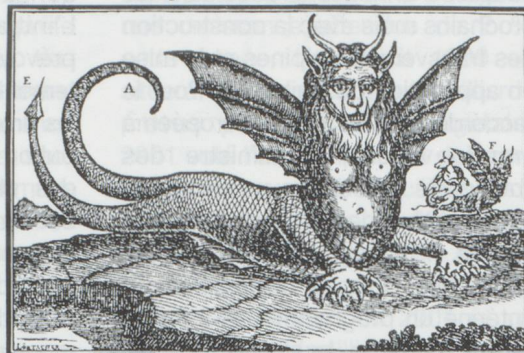
Gravure sur bois du « Messenger boiteux » de 1786 reproduite dans l'édition 1986.

réécits et des nouvelles proches des populations campagnardes. Par ailleurs, bien que solidement appuyé au passé, l'almanach ne refuse nullement le modernisme dans ce que ce dernier offre de durable. Durable ! Voilà sans doute le mot-clé de cette publication, qui est l'anti-mode par excellence. C'est pourquoi l'almanach vit encore, tandis que la mode doit mourir très vite pour faire place à une autre mode. La tonalité générale du Messenger boiteux est un optimisme prudent, plutôt terre à terre, ne se payant pas de mots et faisant sienne la philosophie chère à La Fontaine : " Aide-toi, le ciel t'aidera ". On peut trouver plus mal comme patronage.