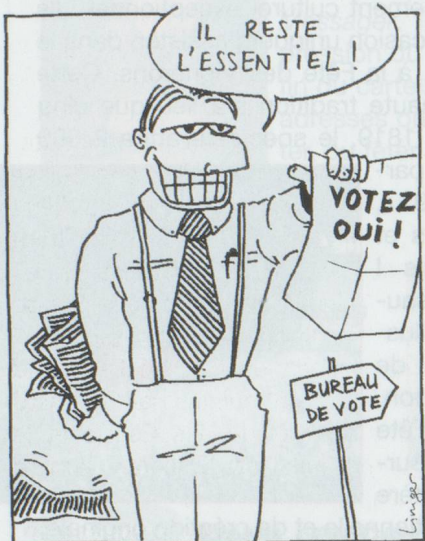
TEXTE ROMAND : UN PEU ÉCOURTÉ!

Nouvelle constitution : Le texte définitif de la mise à jour de la Constitution a été rendu public. Il a été publié officiellement dans la Feuille fédérale et paraîtra prochainement sous forme de brochure. Celle-ci peut être obtenue gratuitement auprès de l'Office central