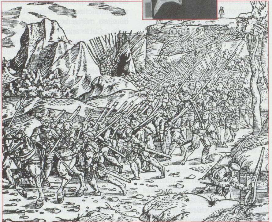
« Conquête du Pays de Vaud par les Bernois ». Chronique de Johannes Stumpf, 1548.

Les Vaudois sont allés bien au-delà de la simple prise en compte de l'arrivée d'un nouveau seigneur dans la région en lieu et place des évêques de Lausanne ou des comtes de Savoie. On les voit notamment prendre les armes pour défendre Leurs Excellences lorsque les paysans de l'Emmental se révoltent et attaquent Berne. Les troupes vaudoises n'ont pas hésité à malmenier ces sujets en colère contre leur maître, plutôt que de les rejoindre sur le sentier de la révolte.