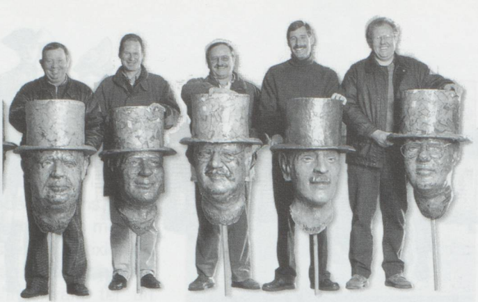
La gueule de l'emploi : originalité de la traditionnelle visite des vignes façon 1999, les visages des experts étaient sculptés d'après nature. S'il fallait encore une preuve du perfectionnisme à la Rochemais.

Les directives édictées par la Confrérie des vignerons concernant les travaux et la visite de la vigne sont strictes : le vigneron cultive la vigne pour obtenir des récoltes de bonne qualité et, si possible, régulière d'année en année. Il évitera toute dégradation du sol et maintiendra les ceps en bon état pour en assurer la longévité. L'expert, accompagné d'un conseiller de la Confrérie examinera les vignes des propriétaires qui en ont manifesté le désir. Cela représente quelque 250 hectares, 600 parcelles entre Pully et Bex. Ces vignes, il faut aller les voir de près, prendre les petits chemins, monter,