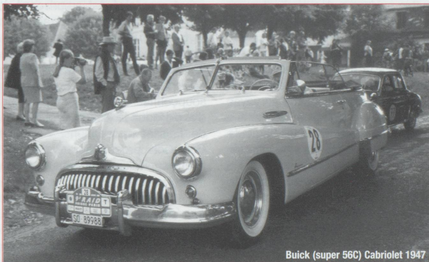
Buick (super 56C) Cabriolet 1947