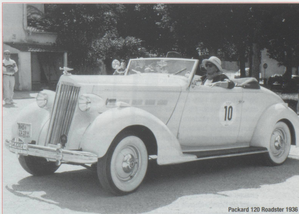
Packard 120 Roadster 1936

Yaxa, créée par Charles Baehni, ► Suite page 21