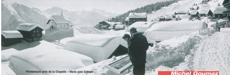
Promeneurs près de la Chapelle - Maria zum Schnee