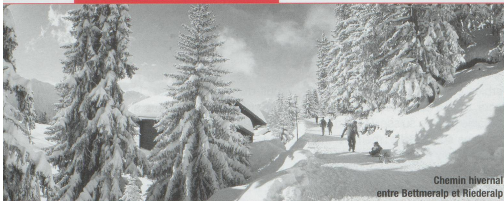
Chemin hivernal entre Bettmeralp et Riederalp

► te sera comblé. Celui qui recherche une neige profonde garantie jusqu'au printemps montera à 2 000 m jusqu'à Arolla. Il skiera avec un immense plaisir et sans trop de difficultés, escorté par quelques choucas évoluant dans un ciel d'azur. Le soir venu, au « carnotzet » de l'hôtel, une raclette accompagnée de viande séchée et de fines tranches de pain de seigle ne se refuse pas. Si l'envie d'aventure vous prend, vous pourrez monter au Pigne d'Arolla en hélicoptère et faire une descente fabuleuse sous la conduite indispensable d'un guide de haute montagne.