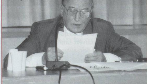
À la tribune des Rencontres Paneuropéennes

dans le monde et l’Europe (voir encadré).