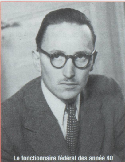
Le fonctionnaire fédéral des années 40