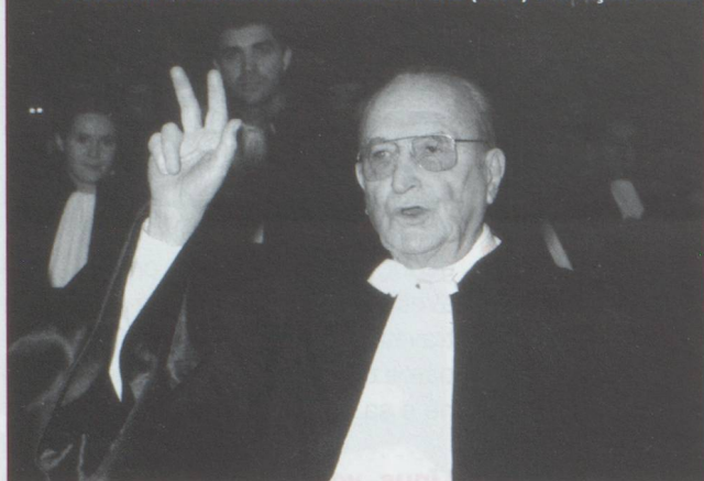
Prestation de serment au Barreau de Paris (1996) à la façon suisse