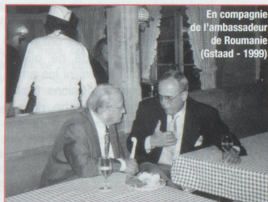
En compagnie de l'ambassadeur de Roumanie (Gstaad - 1999)

" ... son amour inconditionnel de la vie et sa délicieuse ironie, sa fidélité à ses idées, son engagement pour toute une série de causes nobles qu'il a défendues avec engagement et acharnement, les discussions contradictoires que nous avons eues, sa curiosité de connaître personnes et choses, enfin son hospitalité merveilleuse à Wissous ".