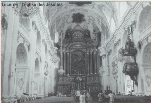
Lucerne : l'église des Jésuites

Poursuivant la route, passant par Brunnen, nous empruntons l'Axenstrasse, toute en tunnels, devenue aujourd'hui parfaitement carrossable en perdant quelques-uns de ses attraits saisissants, pour arriver à Fluëlen. Nous allons quitter le bord du lac pour Altdorf, séduisante capitale du canton d'Uri, avec ses maisons patriciennes et ses belles fontaines. En plein centre, il est impossible de manquer le monument de Guillaume Tell, adossé à une tour