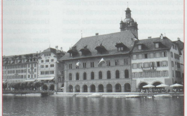
Lucerne : l'ancien hôtel de ville

ou l'hôtel des Balances à la façade richement décorée. Au centre de la place, une fontaine gothique représentant saint Maurice, le patron des soldats et des guerriers. La flânerie dans les ruelles bordées de boutiques et magasins élégants fait partie des « immanquables ». Sur la rive opposée, la grande église des Jésuites, à la façade sobre, encadrée par ses clochers à bulbe, est le premier exemple de construction baroque en Suisse. Les stucs de la nef sont d'inspiration rococo. La gare terminus, entièrement ravagée par un incendie a été reconstruite dans le style actuel, seul le porche d'entrée a résisté et se trouve maintenant isolé, tel un arc de triomphe, face au débarcadère. Juste à côté,