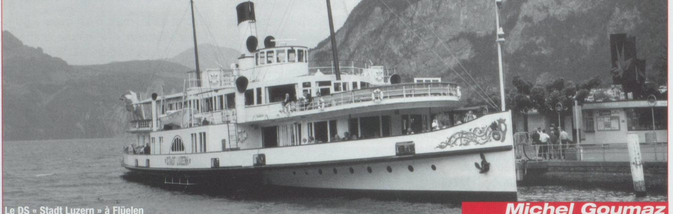
Le DS « Stadt Luzern » à Flüelen

Petite visite guidée du lac des Quatre-Cantons, encaissé entre ses montagnes, étincelant écrin chargé d'histoire planté en plein cœur de la Suisse.