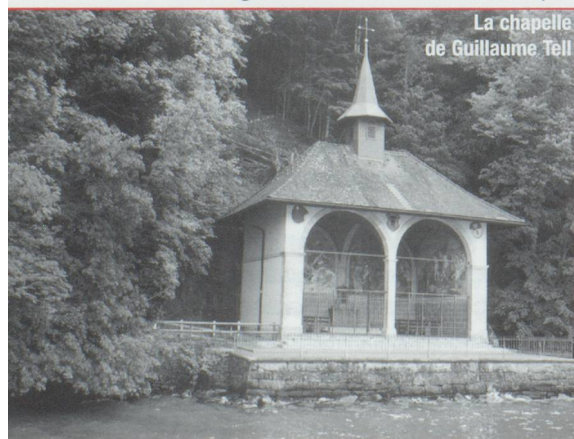
La chapelle de Guillaume Tell