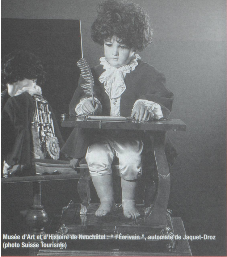
Musée d'Art et d'Histoire de Neuchâtel : "l'Écrivain", automate de Jaquet-Droz

► œuvres des grands impressionnistes et d'artistes suisses réputés, des tableaux d'Auguste Bachelin qui fut une des personnalités neuchâteloises les plus rayonnantes du XIX e siècle. Ses grands tableaux représentant les soldats suisses de 1871 et les Bourbaki, ses dessins de costumes de cortèges historiques marquèrent son époque.