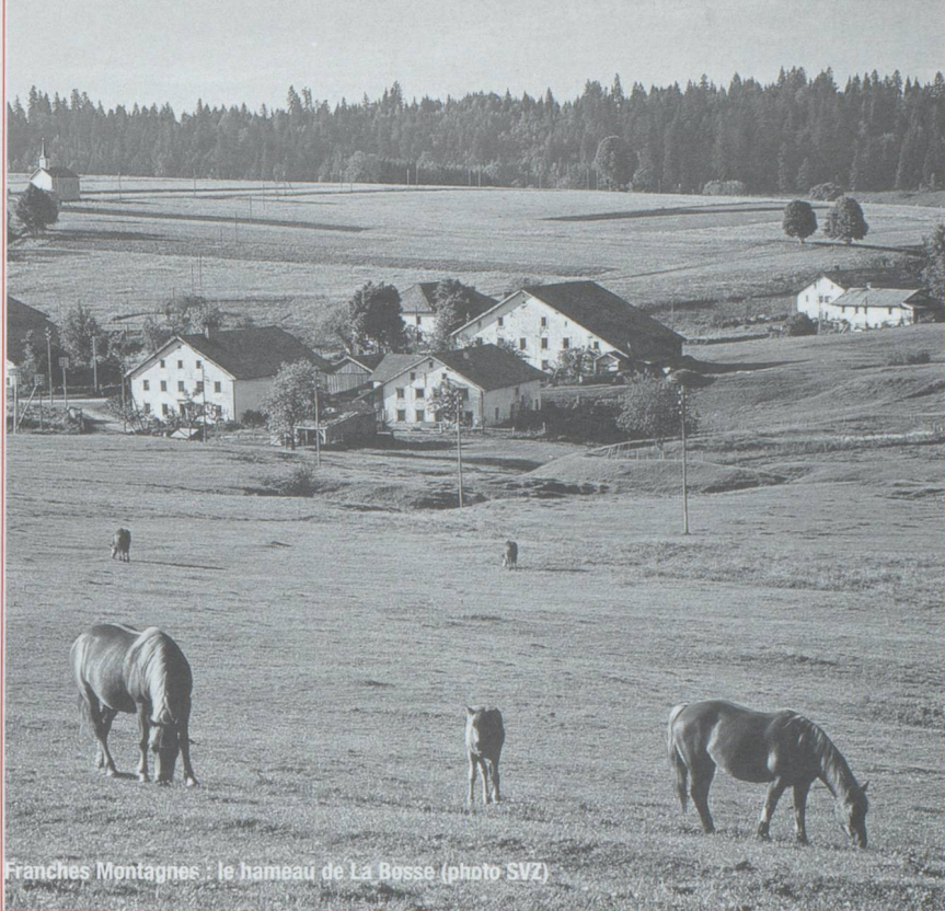
Franches Montagnes : le hameau de La Bosse

Il fut un temps pas si lointain où faire le voyage de Neuchâtel à la Chaux-de-Fonds en hiver n'était pas une sinécure. Le passage du col de la Vue des Alpes, souvent enneigé, ressemble parfois à une expédition laborieuse. Pourtant, arrivé au haut