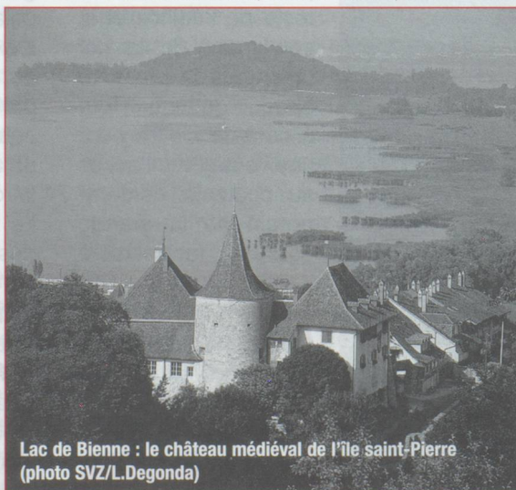
Lac de Bière : le château médiéval de l'île saint-Pierre

Au sud, en forme d'« i » majuscule allant du bas vers le haut, Auvernier, resté village viticole, est devenu aujourd'hui un lieu de résidence privilégié. Il vaut la peine de s'arrêter sur les hauts de la commune pour admirer les toits de ses demeures avant de descendre la grand-rue, bordée de belles maisons du XVI e siècle pour se rendre à la cave, goûter le fameux chasselas gouleyant. Colombier, avec son terrain de Plaineyse, est devenu un des centres de l'aviation légère en Suisse, Vaux-Marcus, situé légèrement sur la hauteur, se targue d'avoir un superbe château. Au nord, Saint-Blaise, avec