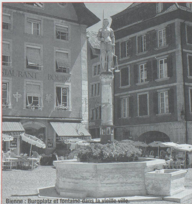
Bienne : Burgplatz et fontaine dans la vieille ville.