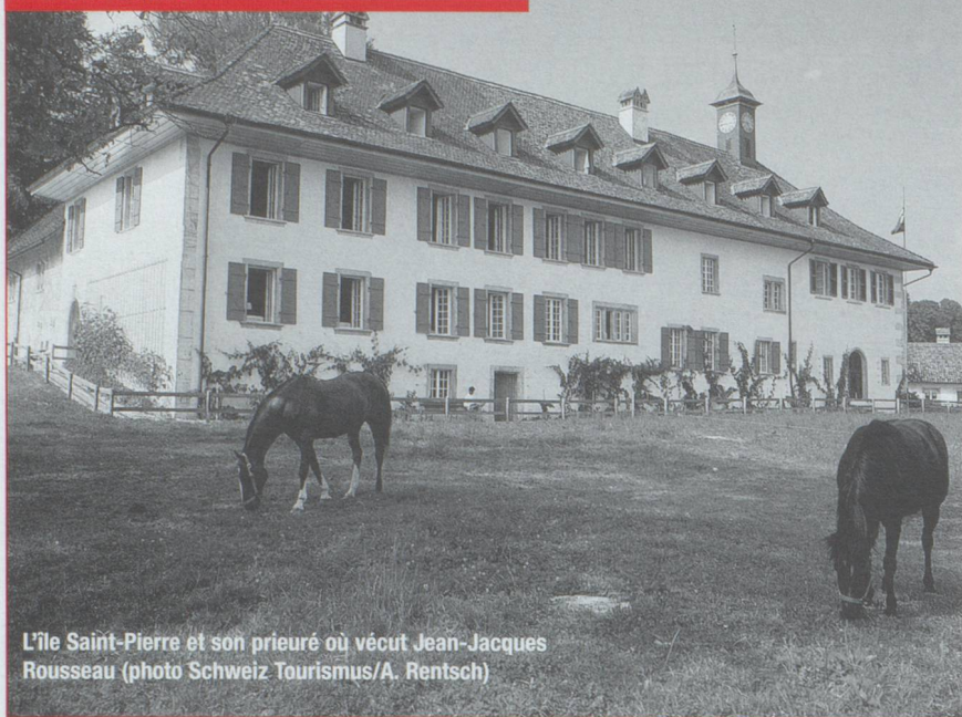
L'île Saint-Pierre et son prieuré où vécut Jean-Jacques Rousseau

▶ passant par le petit col des Roches, voici le lac des Brenets, un double national, en forme de fjord, sur lequel il faut faire une petite croisière pour se rendre à son extrémité nord et marcher le long d'un sentier facile pour mériter le spectacle de la chute du Saut-du-Doubs. À quelques kilomètres du Locle, vers le sud, c'est la Brévine, surnommée la Sibérie helvétique, qui bat régulièrement tous les records de froid du pays. En bifurquant à gauche, après un petit col au charme très jurassien, vous arriverez dans le Val de Travers.