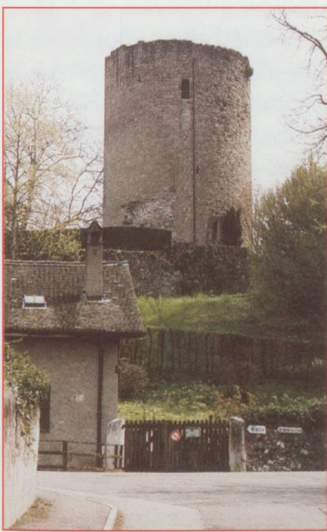
La tour d'Hermance

En guise de conclusion, les paroles de Jean-Pascal Delamuraz, un amoureux inconditionnel du lac et conseiller fédéral, forment la plus belle des invitations :