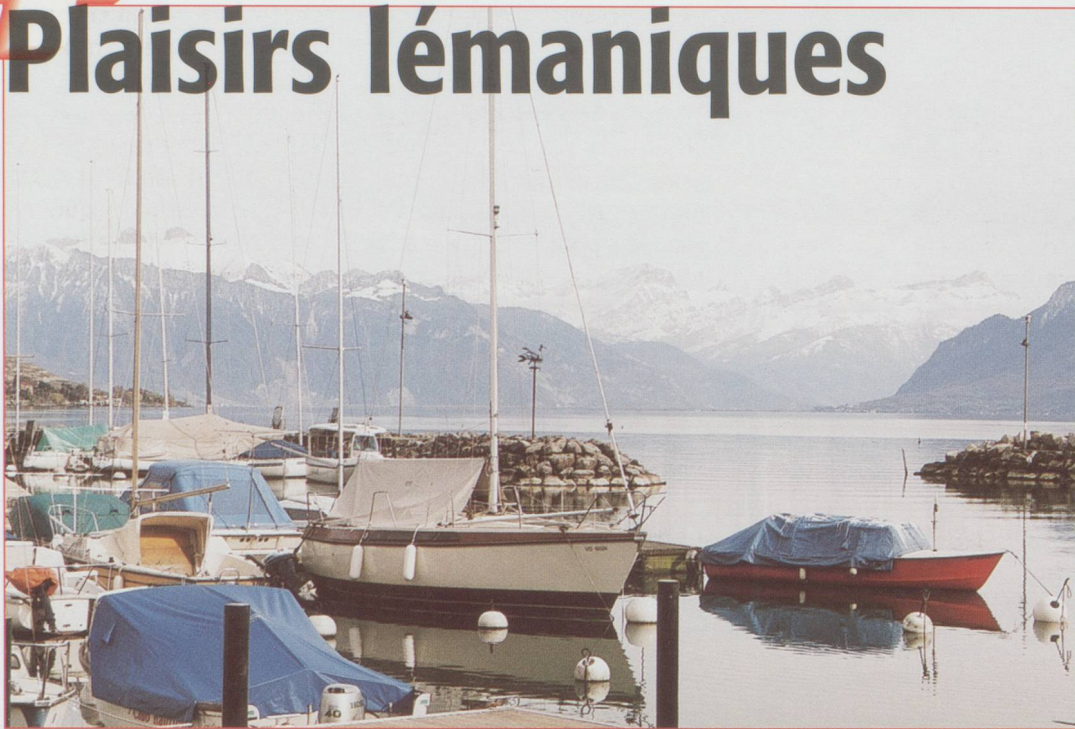
Le port de Cully

Avec " Swiss Magazine ", vous saurez tout sur... le Léman : ses villages pittoresques, ses musées attachants, ses vents, ses bateaux. Embarquement immédiat pour une croisière... de plaisirs.