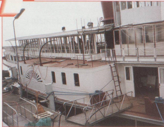
Le «Montreux». Il sera plus beau qu'avant !