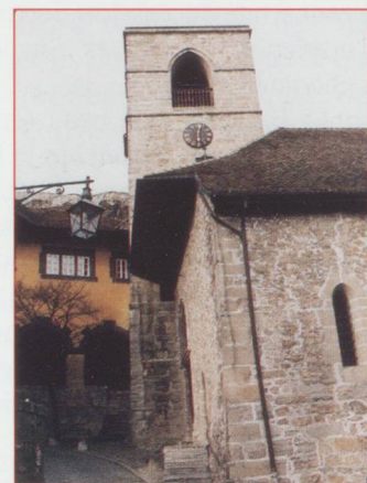
Saint-Saphorin : l'église

Le Bouveret est un village dynamique car deux parcs