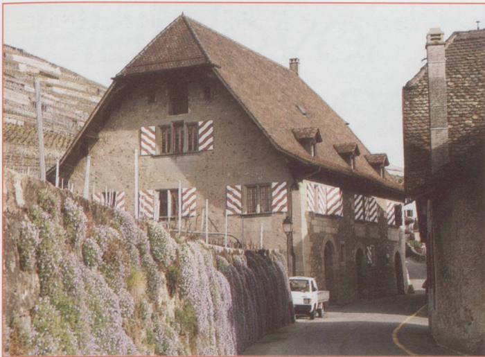
Maison vigneronne (village de Villette)

d'accoster, doit faire tourner son grand bateau blanc. Mais notre homme est un champion, deux ou trois petits coups de marche arrière et de marche avant, il sait maîtriser la force de plus en plus vive de l'eau qui l'entraîne vers le pont du Mont-Blanc, tout proche. Le navire est à quai. Nous avons fait une