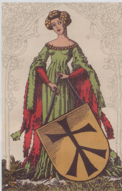
Armoiries de la famille Faesch.