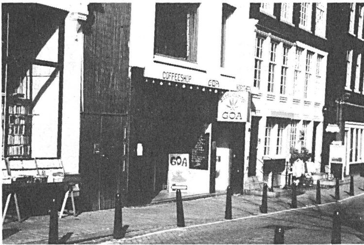
Einer der rund 200 Coffeeshops