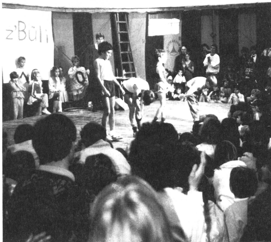
Aktionswoche '87: "Gsund in Büli" Oktober 1987 in Bülach

In meinen Erläuterungen werde ich zuerst den Gesundheitsbegriff von RADIX umschreiben und dann darauf eingehen, wie eben diese Gesundheit gefördert werden kann. Drei konkrete Beispiele aus meiner Praxis sollen veranschaulichen, was gemeindenahere Gesundheitsförderung bedeuten kann. Abschliessend werde ich versuchen, einige grundsätzliche Erkenntnisse aus den gemachten Erfahrungen zu ziehen.