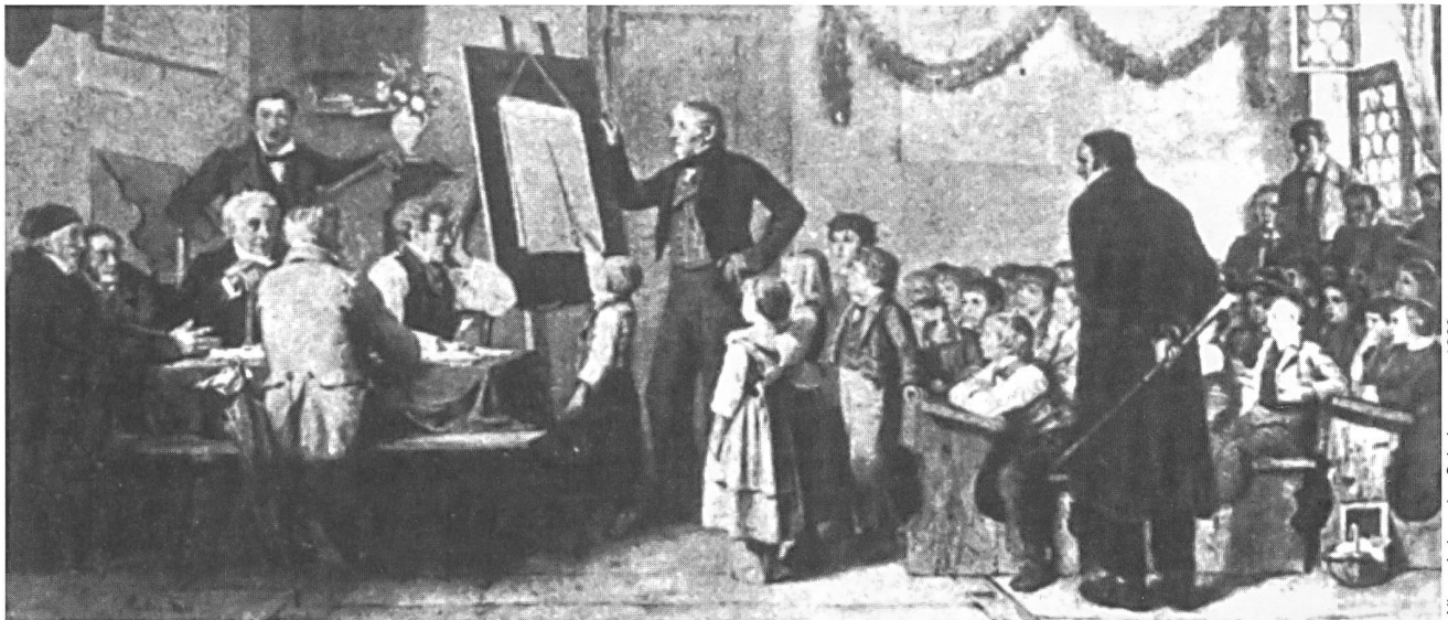
Albert Anker, das Schullexamen, 1862

dürfnisse nach Liebe, Zuwendung und Geborgenheit, da die Bezugspersonen kaum zur Verfügung stehen, nur im Konsum von Gütern und Mitteln befriedigt werden, was wiederum die steigende Tendenz des Missbrauchs aller möglichen Mittel zeigt.