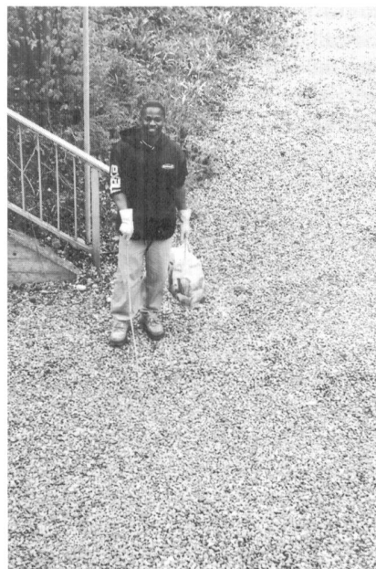
Beschäftigung – Reinigungsarbeiten in der Asylunterkunft.