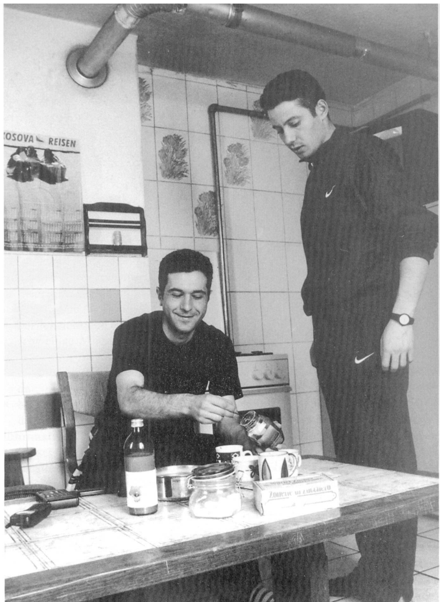
Asylunterkunft – Küche, Bad, Aufenthaltsraum in Einem.

Die grossen Kantone bringen die, nach einem bevölkerungsproportionalen Verteilschlüssel zugewiesenen, Asyl Suchenden in so genannten Durchgangszentren unter, um sie von da aus in die Gemeinden zu verteilen. Die Aufenthaltsdauer beträgt hier ungefähr ein halbes Jahr. Die Wohn- und Schlafverhältnisse sind eng. Familien werden in einem Zimmer untergebracht. Die BewohnerInnen erhalten obligatorischen Deutschunterricht. Manchmal werden Freizeit- und Beschäftigungsaktivitäten angeboten. Es wird zusammen gekocht und versucht, Jugendliche in einem Beschäftigungsprogramm unterzubringen. Entweder wird in der Gemeinschaftsküche gekocht und verpflegt und nur das Taschengeld ausbezahlt oder das Essensgeld wird noch dazugelegt. Heute beträgt dies zusam-