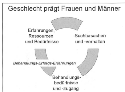
Darstellung 1: Geschlecht prägt Frauen und Männer

Vernetzung: Mit der Publikation von «Frauen – Sucht – Perspektiven» 9 liegt 1995 erstmals eine umfassende Sichtung und Zusammenstellung nationaler und internationaler Forschungsgrundlagen zur Thematik Frauen und Sucht vor. Auf der Basis dieser wissenschaftlichen Grundlagen wird für Frauengerechte Drogenpolitik und Arbeit ein Konzept entworfen, welches 1996 an einer nationalen Tagung präsentiert wird. Ein zentrales Ergebnis der Studie ist, dass alle Aspekte und Erfahrungen im Zusammenhang mit Sucht je nach Geschlecht unterschiedlich geprägt sind und fortlaufend unterschiedlich geprägt werden (vgl. Darstellung 1).