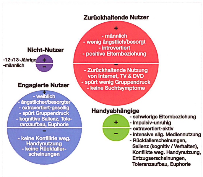
Abb. 2: Typologie der HandynutzerInnen und die wichtigsten Merkmale. 9 Begriffe auf der obigen Seite (+) bedeuten, dass diese Aspekte bei den entsprechenden Nutzertypen jeweils überdurchschnittlich oft auftreten.

Aus den Studienergebnissen lässt sich eine Reihe von Schlussfolgerungen für die Praxis ableiten. So deuten die Befunde darauf hin, dass Verhaltenssucht im Kontext eines Mobiltelefons eine eigene Charakteristik aufweist und nicht eine versteckte Internetsucht darstellt. Allenfalls könnte eine