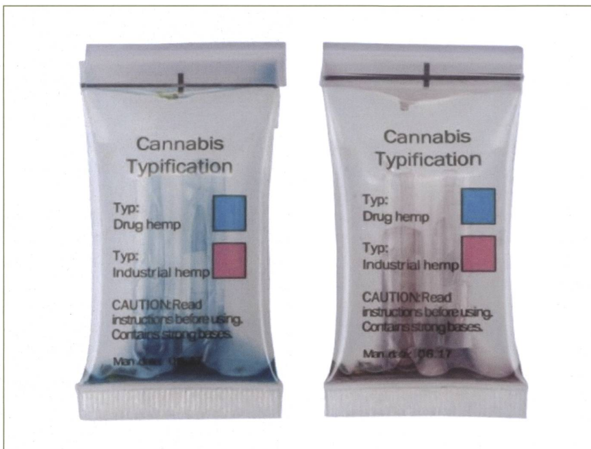
Abbildung 2: Positiver und negativer CBD-Schnelltest

Eine wichtige Erkenntnis der Cannabis-Drug-Checkings ist, dass die gesundheitsgefährdenden Synthetischen Cannabinoide in fast allen Fällen auf CBD-Produkte aufgetragen werden. Dies ermöglicht es Konsumierenden, mithilfe eines CBD-Schnelltests eine erste Selbstanalyse durchzuführen, wenn eine professionelle Analyse der Substanz nicht möglich ist. Davon ausgehend, dass Käufer:innen ein klassisches THC-Cannabis erwerben möchten, zeigt dieser Test mit einem positiven CBD-Resultat an,