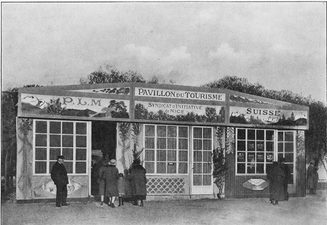
Pavillon der Schweizerischen Verkehrszentrale an der Mustermesse-Ausstellung in Nizza 1926.