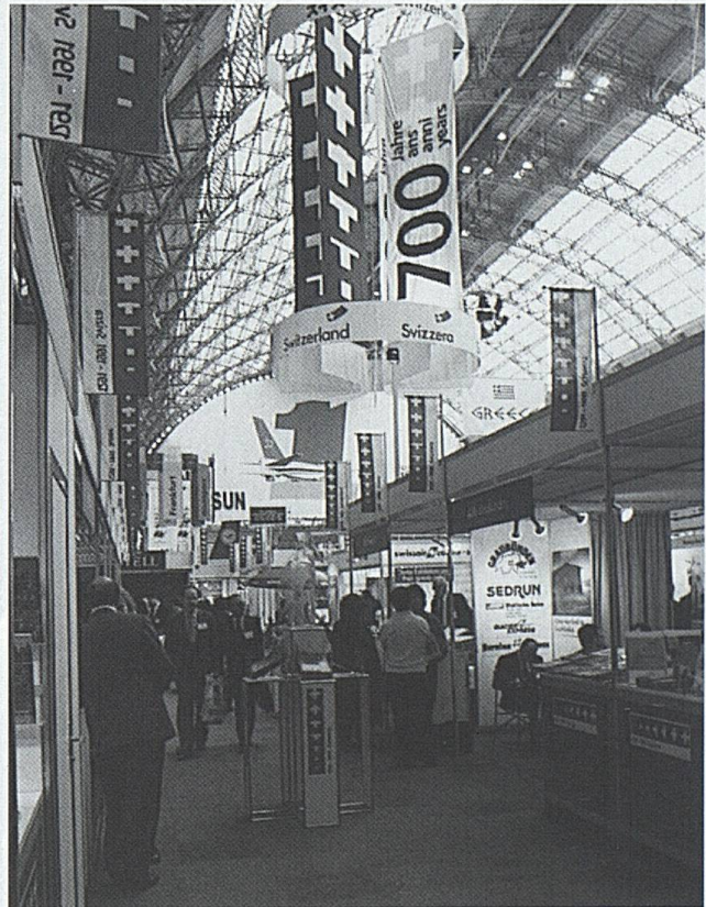
Startschuss für das Werbethema 1991 am World Travel Mart in London.

büromitarbeiter in Locarno, Teilnahme an Confex Exhibition zusammen mit Swiss Congress, Teilnahme an ABTA/ANTOR Workshops in Leeds, Belfast, Norwich und Southampton. Durchführung von Workshops für Zentralschweiz-Delegation in London, Birmingham, Manchester. Gemeinschaftsstand mit Swiss Travel System, Swissair, regionalen und lokalen Verkehrsvereinen an der Daily Mail International Ski Show (97 000 Besucher); Grosser Schweizer Stand mit Mobile und Swissair Coffee Shop am World Travel Market mit 24 Schweizer Ausstellern (rund 40 000 Besucher und 2000 Medienleute).