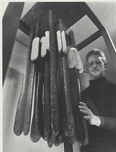
«Klingende Steine» werben als Mini-Expo für die Schweiz.

Mini-Expos wurden für die Koko-Mitglieder hergestellt zum Einsatz in Schaufenstern, bei Schweizer Wochen und Schweiz-Veranstaltungen. Bis dato sind vier solche Ausstellungseinheiten verfügbar. 17mal wurden weitere SVZ-Ausstellungen eingesetzt.