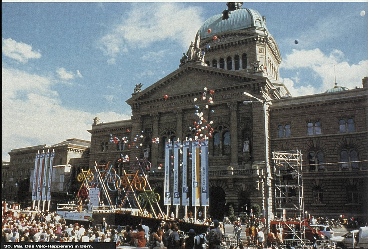
30. Mai. Das Velo-Happening in Bern.

Am 30. Mai wurde das «Veloland Schweiz» in Anwesenheit von Bundesrat Adolf Ogi in Bern mit einem grossen Velo-Happening eröffnet. Die gesamte wichtige Fach- und Publikums- presse der Schweiz, zahlreiche ausländische Magazine und Zeitungen und internationale TV- und Radio-Stationen berichteten über das «Veloland Schweiz».