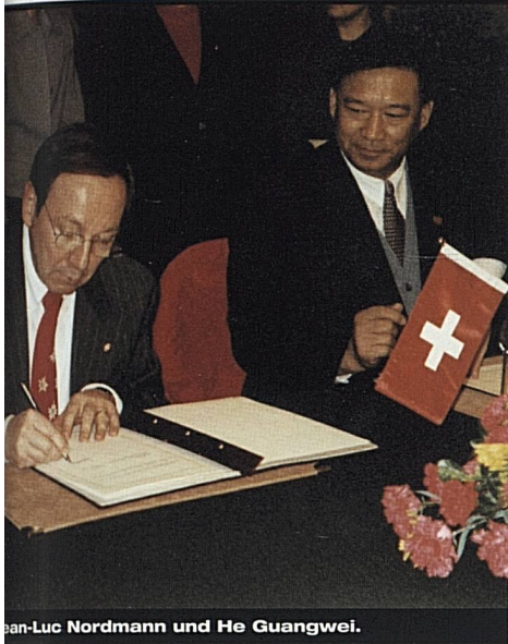
Jean-Luc Nordmann und He Guangwei.

für die Erschliessung des chinesischen Markts gelegt. Eine Delegation unter der Leitung des CNTA-Präsidenten He Guangwei stattete der Schweiz im Mai 1998 einen Besuch ab und empfing anlässlich der Eröffnung des CNTA-Büros in Zürich 80 Vertreter aus Politik, Wirtschaft und Tourismus.