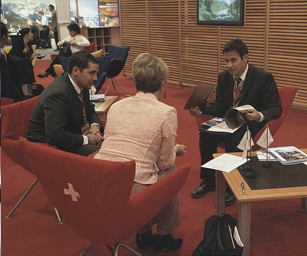
Forderte am Ferientag mehr Mut: Alt-Bundesrat Adolf Ogi. L'ancien conseiller fédéral Adolf Ogi exhorte à faire preuve d'audace.