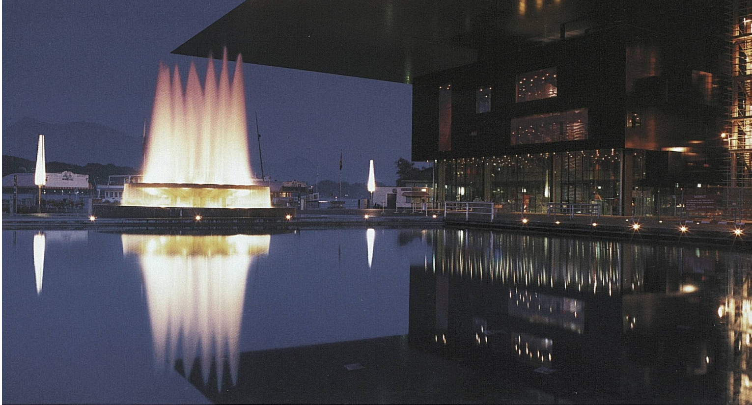
Im Kultur- und Kongresszentrum Luzern findet im Dezember die Verlosung für die Fussballspiele der UEFA EURO 2008™ statt Le Centre de la culture et des congrès de Lucerne accueillera en décembre le tirage au sort final pour les matchs de football de l'UEFA EURO 2008™