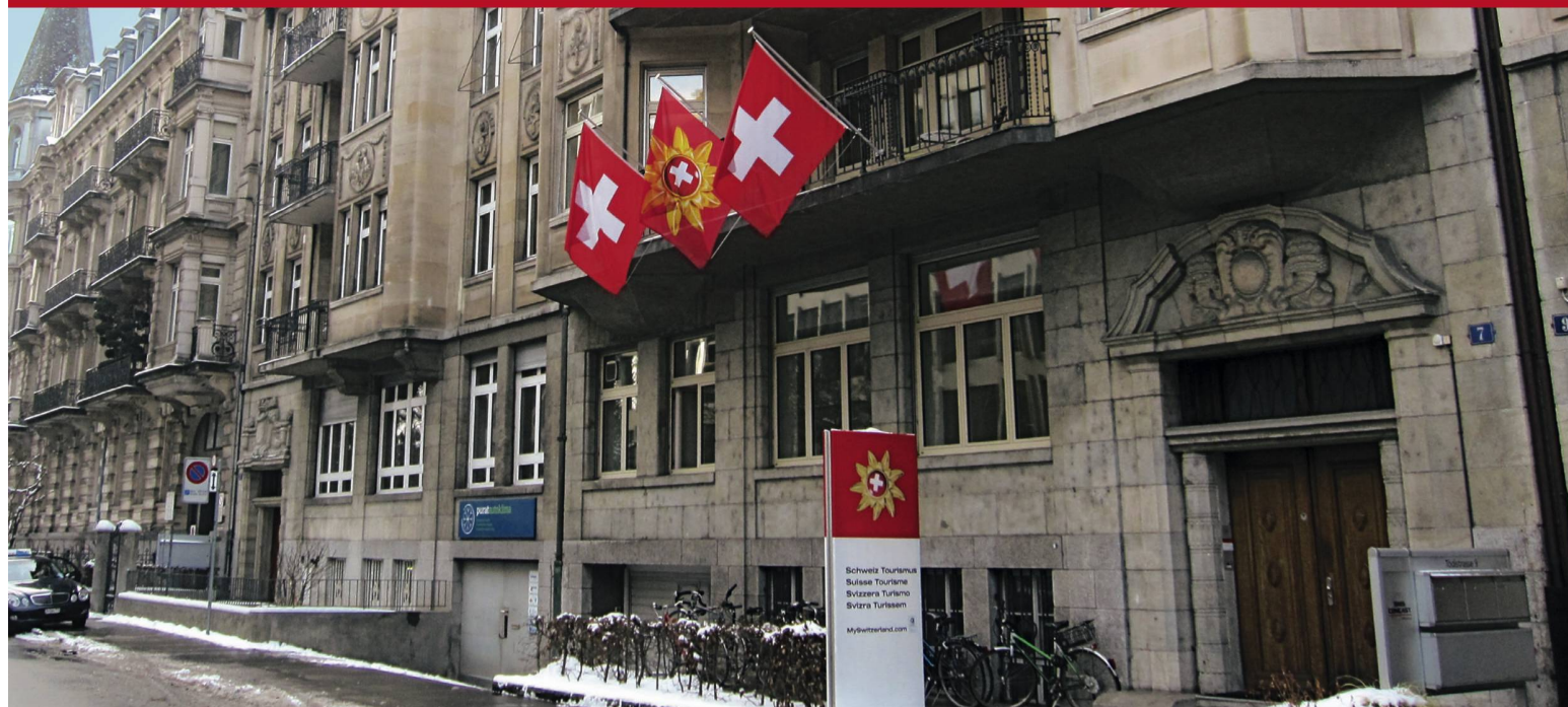
Schweiz Tourismus ist in 20 Ländern vertreten. Am Hauptsitz an der Tödistrasse in Zürich laufen die Fäden zusammen. Suisse Tourisme est représenté dans 20 pays. C'est au siège de la Tödistrasse, à Zurich, que sont coordonnées toutes les activités.