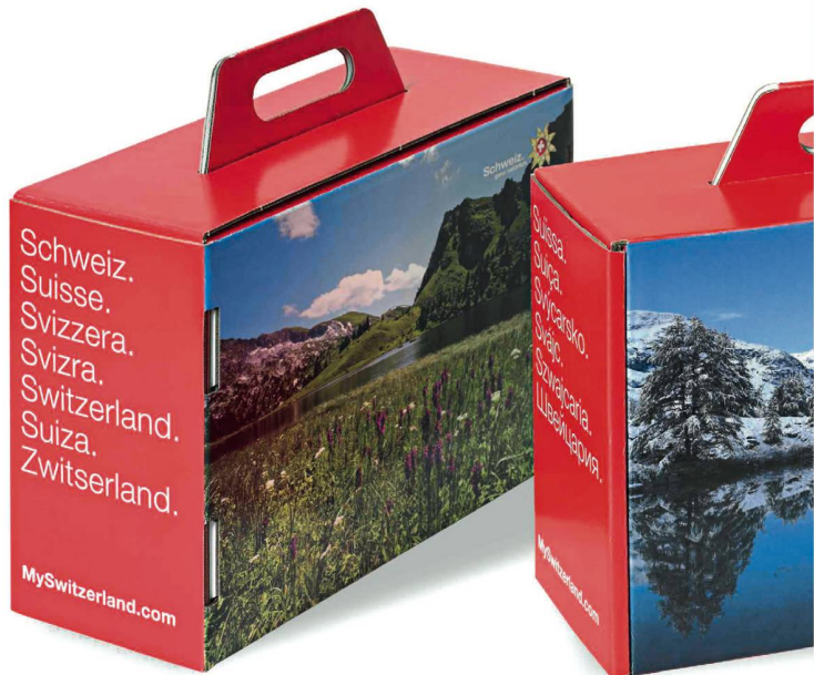
Vollgepackt mit «Schweizereien»: der Promotionskoffer. La mallette de promotion: un petit concentré de Suisse.